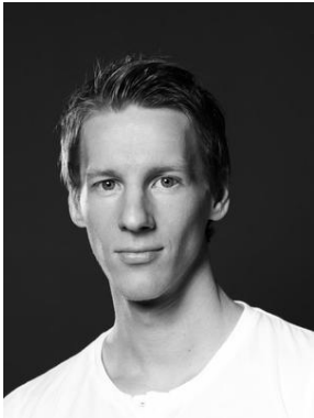
Produzent, Director Film Berater "Digitale Medien"